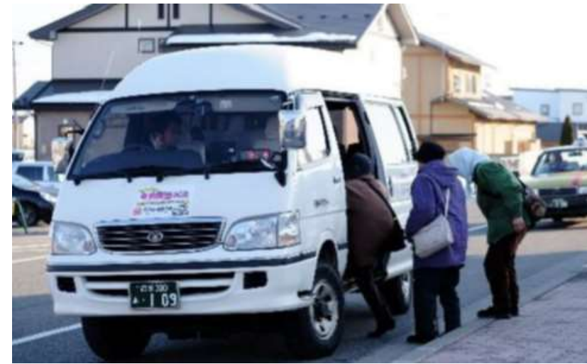
(「乗合タクシー事例集」(全国ハイヤー・タクシー連合会)より)

▶タクシー事業者が自治体と連携する等により提供する乗合の運送サービス。地域のニーズに応じて多様な形態で運行。