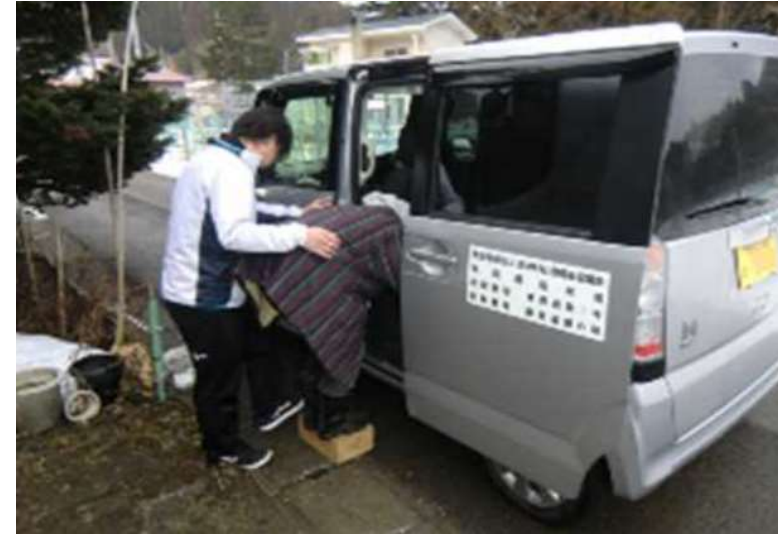
(「自家用有償旅客運送事例集」(国土交通省)より)

▶バスやタクシーが運送を行うことが難しい場合に、市町村や住民がつくる組織が対価を受け取って運送を行うサービス