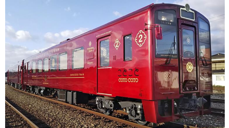
観光列車 ことこと列車