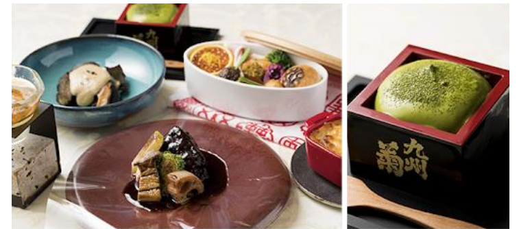
フレンチコース料理