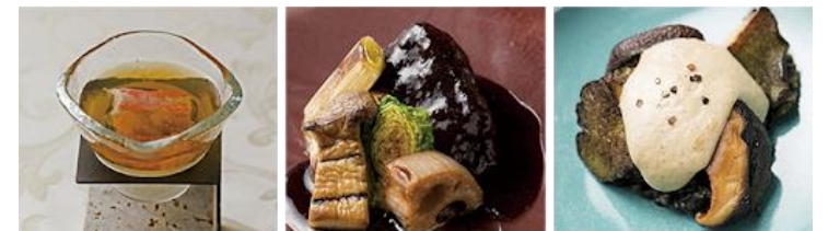
季節野菜のブランマンジェ